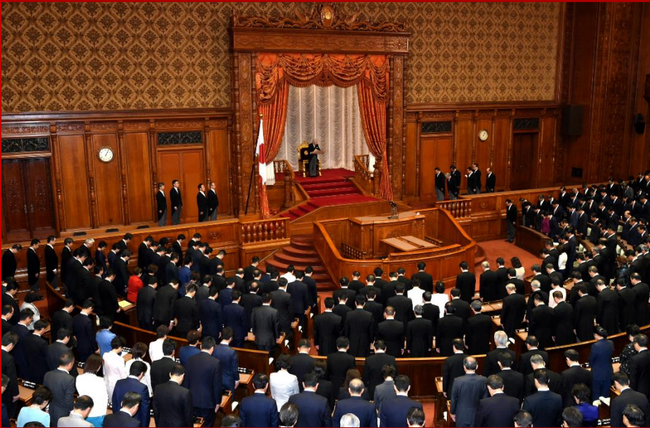
写真は11月8日 特別国会開会式の様子です。天皇陛下をお迎えし、開会のおことばを頂きました。

〒100-8962 東京都千代田区永田町 2-1-1 参議院議員会館 1101 号室 ☎：03-6550-1101 ☎：03-6551-1101 ✉：info@masahiro-ishida.jp