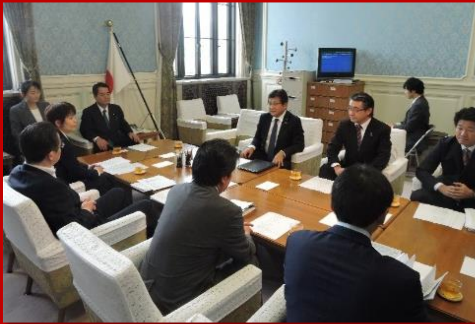
参議院議員運営委員会の理事会の様子です。ここで各政党の意見をしっかりとまとめて本会議に臨みます。