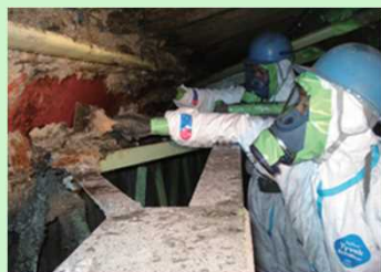
吹付け石綿の除去作業の様子