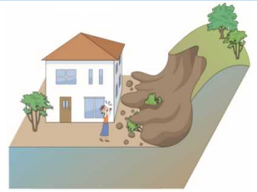
防災上の観点から適正な管理が求められる土地の例(イメージ)

◆「経済財政運営と改革の基本方針2019」(令和元年6月21日閣議決定)(抜粋)